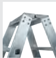
4-fach verschraubtes Leitergelenk

Details auf der jeweiligen Produktseite unter www.steigtechnik.de