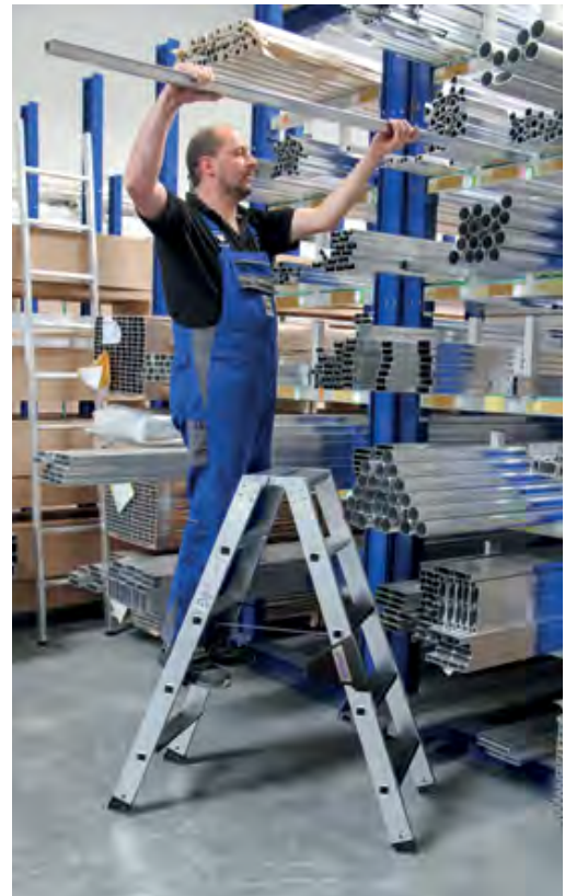
Abb. Bestell-Nr. 43805