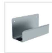
Leiterwandhalter XL Bestell-Nr. 19841